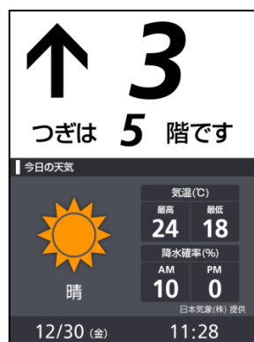
【表示コンテンツ/今日のお天気】

(1)「ビルケアねっとサービス」は、建物管理者が手持ちのパソコンからエレベーターの制御やかご内の情報表示を設定することが可能なサービスメニューです。今回の「アーバンエース」では、業界最大サイズ 8.4 インチのかご内液晶インジケータを生かした表示コンテンツとして、天気やニュースなどの生活情報を基本仕様として拡充します。