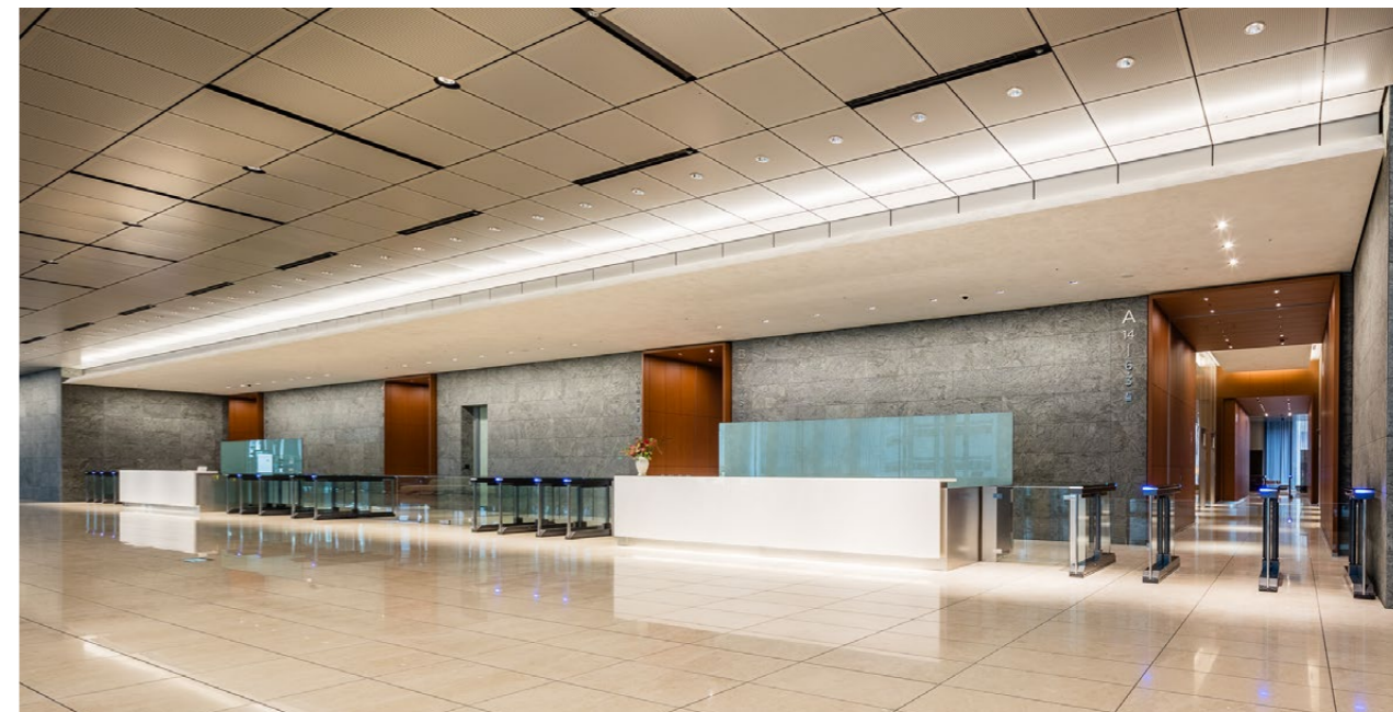
オフィス エントランス