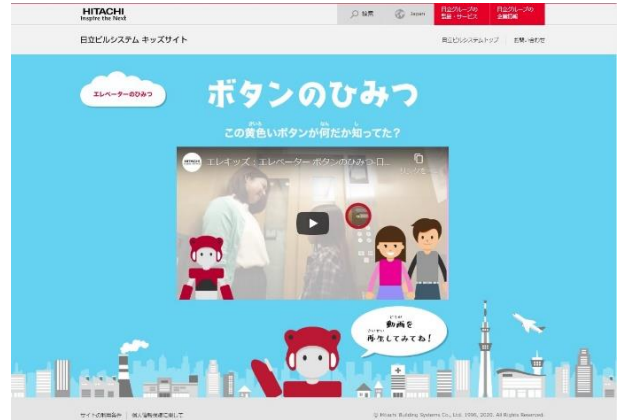
エレベーターのひみつ(動画)