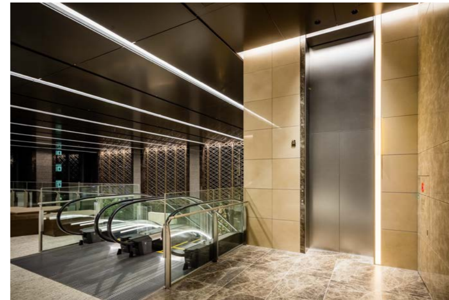
4階 エレベーター乗り場

三方枠 | 大枠 ステンレスパイプレーション仕上げ 幕板 | ステンレスパイプレーション仕上げ 戸 | ステンレスパイプレーション仕上げ ランタン | 建築壁組込み 特殊形状大型ホールランタン ホールボタン | 建築壁組込み