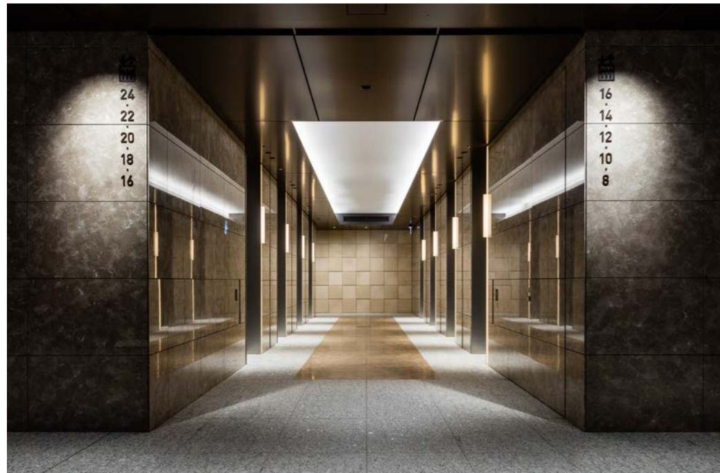
3階 ダブルデッキ エレベーターホール