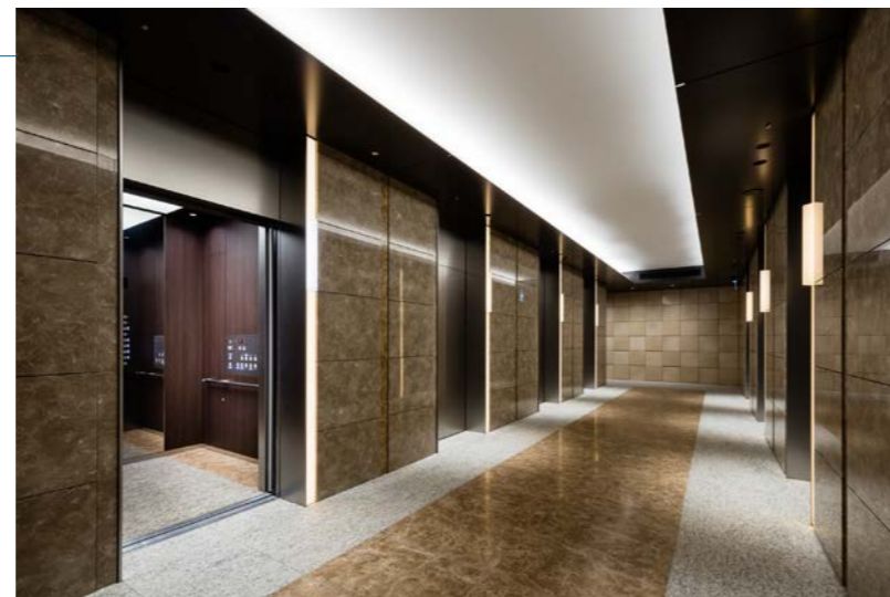
ダブルデッキ エレベーターかご内

三方枠 | 大枠 ステンレスパイプレーション仕上げ 幕板 | ステンレスパイプレーション仕上げ 戸 | ステンレスパイプレーション仕上げ ランタン | 建築壁組込み 特殊形状大型ホールランタン ホールボタン | 建築壁組込み