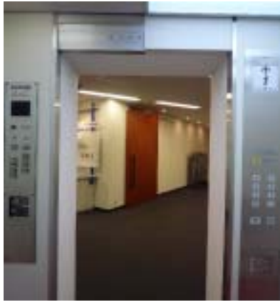
同じかご内の左右に旧型とリニューアル後の意匠を対比して展示