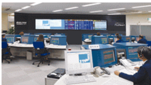
西部管制センター