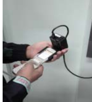
携帯電話型メンテナンスシステム「スーパーキャリコン」